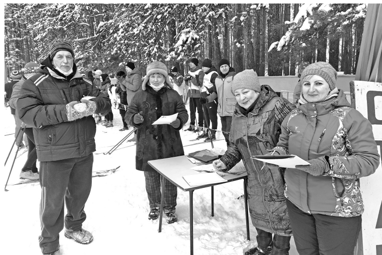
Организаторы лыжной эстафеты, посвящённой юбилею Нижнего Новгорода

Все участники получили специальные или поощрительные призы и памятные сувениры. А командам, занявшим первые места, кроме