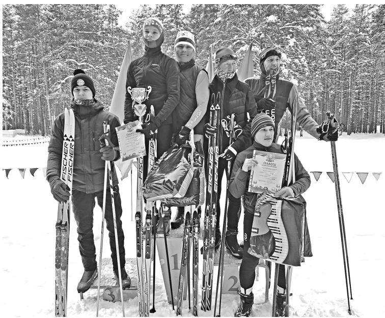
Мужские команды Корпусо-сборочного цеха (I место), Корпусного цеха (II место) и Судомонтажного цеха (III место)