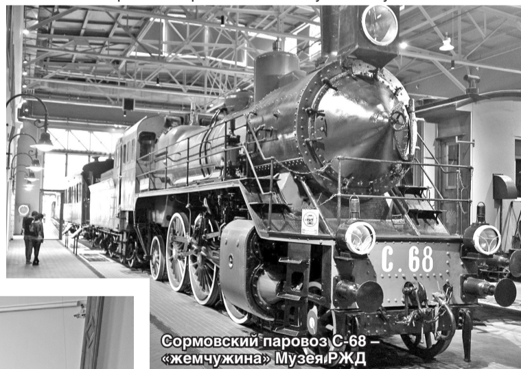
Сормовский паровоз С-68 – «жемчужина» Музея РЖД

Разумеется, в каждом музее сормовичей, прежде всего, интересовало, прослеживается ли здесь та или иная связь с заводом «Красное Сормово». О «жемчужине» музея