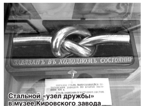
Стальной «узел дружбы» в музее Кировского завода

РЖД – сормовском паровозе – мы уже рассказали. Больше всего исторических параллелей и связей выявилось в Музее истории и техники Кировского завода. Кировский (до 1917 года – Путиловский завод) старшее Сормовского почти на полвека. Оба они основаны в XIX столетии, оба со временем стали заводами-универсалами: выпускали стальное и чугунное литьё, суда, паровозы, трамваи, вагоны, железнодорожные мосты, пушки, снаряды, танки, в военные годы были надёжным арсеналом страны. В музее хранится так называемый «узел дружбы» – образец стального прута, выпускавшегося заводом во второй половине XIX века и завязанного в холодном состоянии. Такой стальной узел рабочие Кировского завода подарили сормовичам в 1971 году: тогда они отмечали 100-летие постройки первой