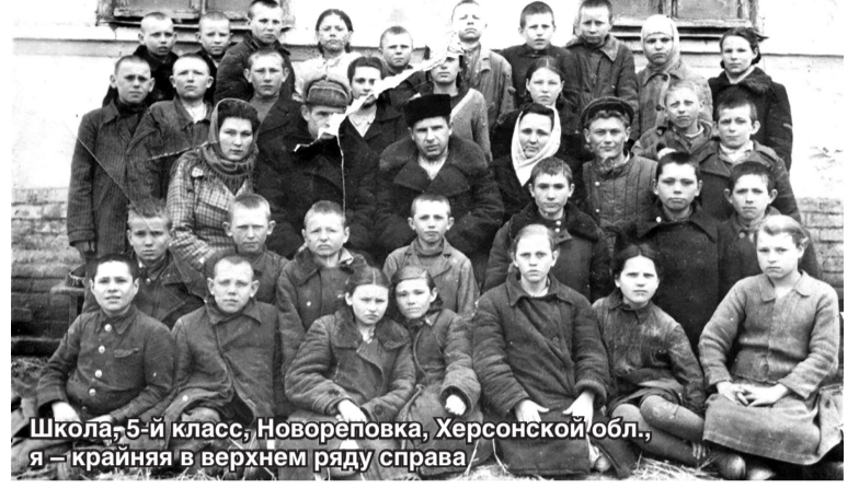
Школа, 5-й класс, Новореповка, Херсонской обл., я — крайняя в верхнем ряду справа

На следующий день всех взрослых выгнали на поля убирать про-