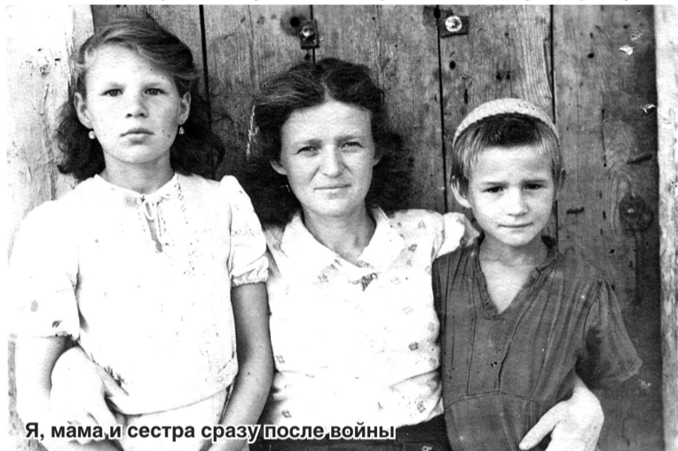
Я, мама и сестра сразу после войны

Немцы пытались разбомбить «НовоРЭС», так как она давала ток на Кубань и в Краснодар. Они решили смуть её в море большой воздушной волной от бомбы в 1000 кг. Таких бомб на Новороссийск было сброшено две, и обе не разорвались. Одна из них пробила крышу в столовой электростанции, образовав большую воронку. Са-