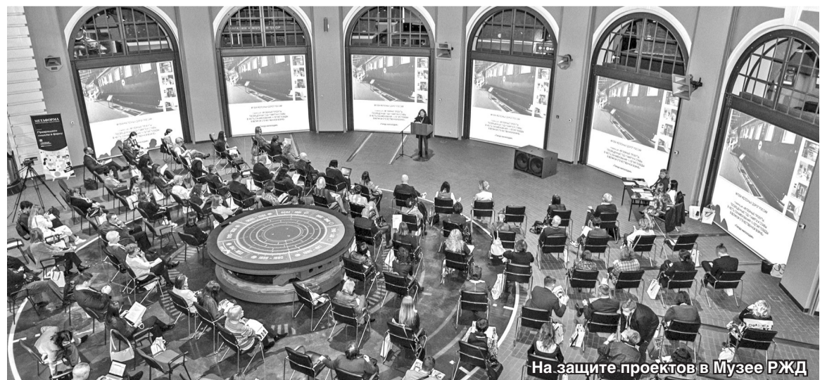
На защите проектов в Музее РЖД

Награждение победителей в номинации «Лучший издательский проект» на сцене белого зала Санкт-Петербургского Политехнического университета