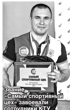
Звание «Самый спортивный цех» завоевали сотрудники КТУ

В этом году добавилась новая номинация – «Самый спортивный цех». Награду и памятные подарки получили сотрудники конструкторско-технологического управления – именно они стали самыми активными участниками соревнований.