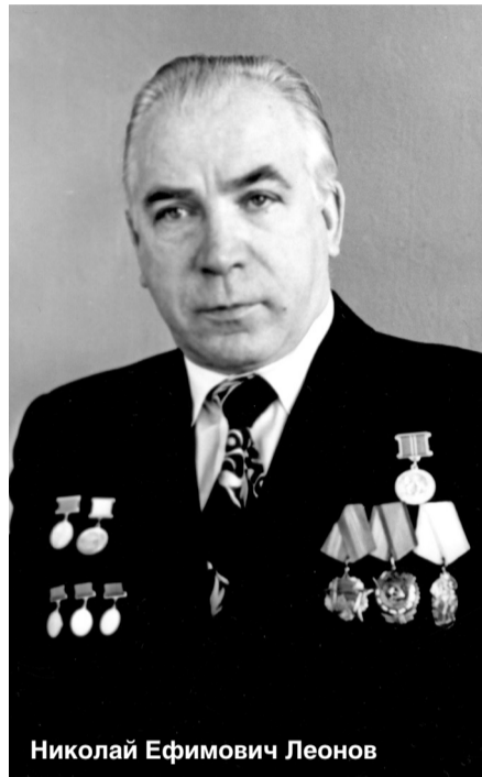
Николай Ефимович Леонов

Еще в 1972 году сормовичи передали ВМФ СССР морской транспортный ракетопогрузчик «Амга» (пр. 1791). Спроектированное севастопольским ЦКБ «Коралл» и внешне замаскированное под танкер, это уникальное судно предназначалось для доставки на субмарины боевых ракет подводного базирования. Став директо-