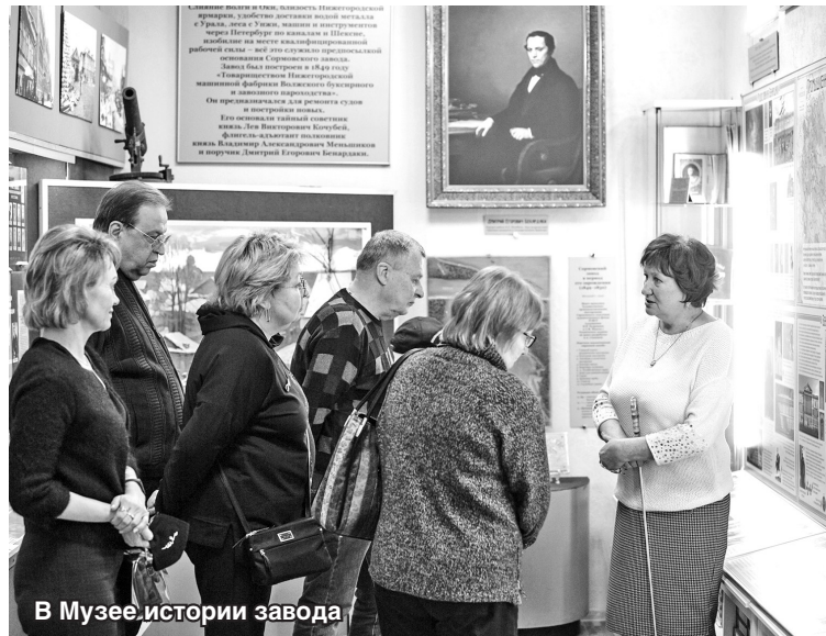
В Музее истории завода